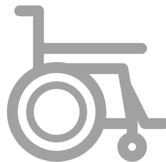
специальные технические средства